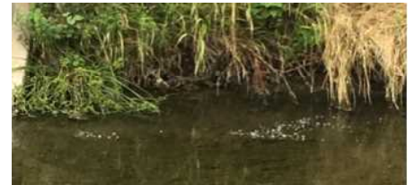
細かい気泡が泡立つ野川