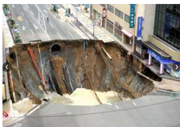
博多駅前陥没事故の二の舞は御免です

これらの異変はホームページに掲載されただけで、沿線自治体や住民にはすぐに知らされませんでした。