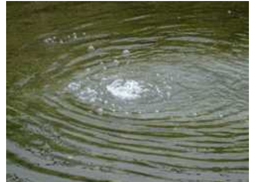
激しく噴出する野川のおぶく(6/14)

★7/4、外環ネットはマシン停止と説明会開催を申し入れ。ガス噴出および地下水流出について、マシンの停止、原因究明、説明会の開催などを求める申入書を事業者に提出。7月中の回答を求めている。